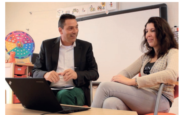
Scene uit video feedbackgesprek

Door de les van een collega op deze manier te observeren reflecteer je ook op je eigen vaardigheden. De cursus sluit af met een video van het feedbackgesprek van een expert met de gefilmde leerkracht. Daarin wordt de les nog eens doorgesproken op deze punten en krijgt de leerkracht – en dus ook de cursist – praktische tips.